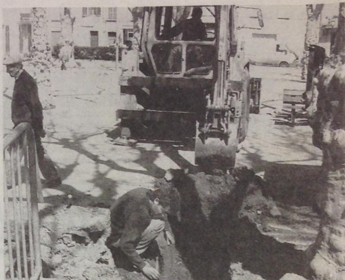
Coup d'envoi des travaux par la pose d'un important pluvial traversant le boulo-drome.

L'homme de l'art a prévu un plan d'eau de 7 m de long avec un fronton semi circulaire. L'accès à la fontaine s'effectuera par